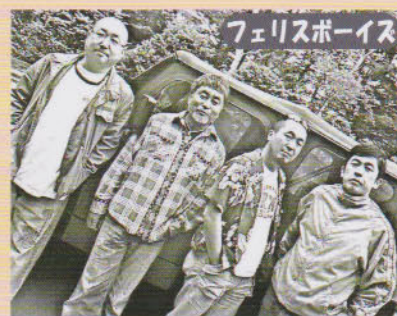
フェリスボーイズ