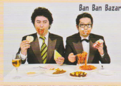
Ban Ban Bazar

みんなでビーチクリーンをして、流した汗が 入場券になるベアフットコンサート。 当日、12:30からビーチクリーンをスタート! ボードウォークに集合してね!